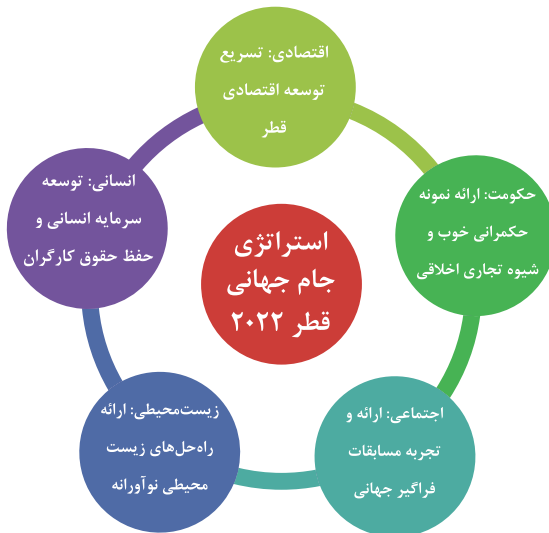
شکل شماره ۲: ارکان استراتژی قطر در جام جهانی ۲۰۲۲

برنامه توسعه ملی ۲۰۲۰ قطر که در سال ۲۰۰۸ تدوین شد، در پی جامعه پیشرفته در پنج رکن اساسی توسعه حکومتی، اقتصادی، اجتماعی، انسانی و زیست‌محیطی است. در چارچوب آن نهادها و سازمان‌های دولتی، غیردولتی، محلی و بین‌المللی در راستای برنامه توسعه هماهنگ شده‌اند. به گفته مقامات قطر ورزش یکی از حوزه‌های است که بر روی هر چهار راهبرد اثرگذار است. برندسازی در حوزه ورزش، جذب گردشگر از طریق ورزش، میزبانی رویدادهای ورزشی از جمله اقدامات ورزشی برای پیشبرد سند ملی ۲۰۳۰ قطر است. در واقع در چارچوب چشم‌انداز ۲۰۳۰ قطر به دنبال این است تا به عنوان کشور استاندارد شناخته شود و ورزش می‌تواند مسیر رسیدن به این هدف را هموار کند. در شکل ارکان سند چشم‌انداز ملی و رابطه آن با صنعت ورزش آورده شده است.